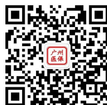
广州医保官方微信