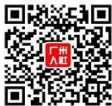
广州人社官方微信

温馨提示： 本宣传资料内容如果与政策文件有出入或政策发生调整，请以最新公布的政策为准。